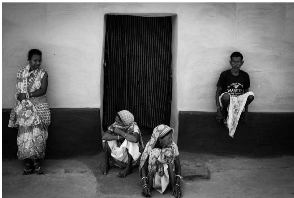
Rural Village di S. Rizzato