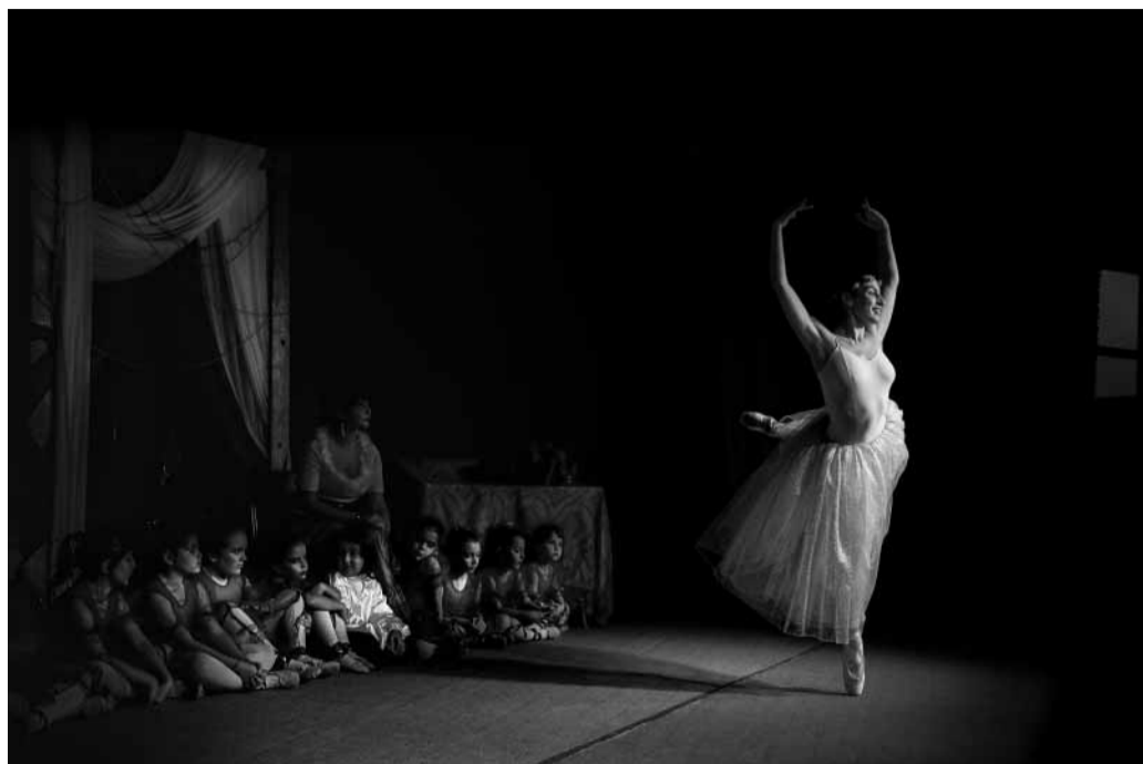
I sogni dei bambini di G. Arangio

organizzato dall'A.P.S. FOTORIFLETTENDO - Le foto vincitrici