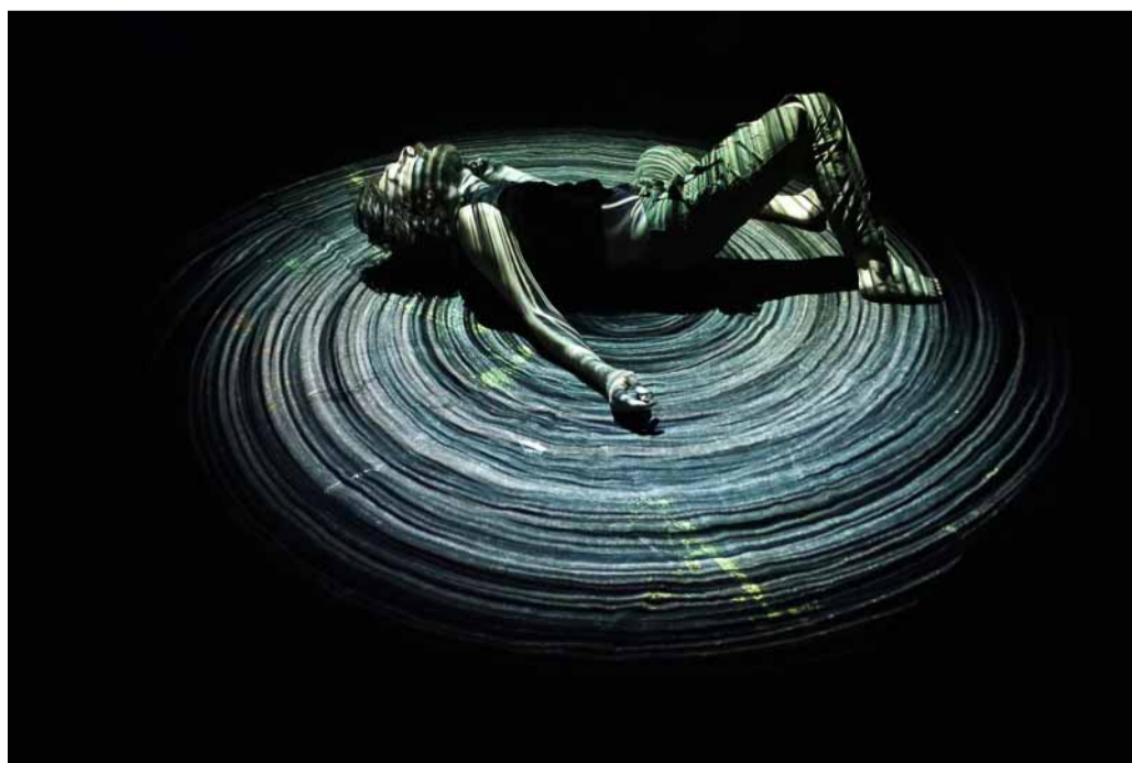
Confusione di V. Gandolfo