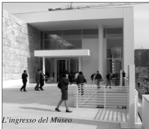
L'ingresso del Museo

A questo punto una domanda sorge spontanea. Perché proprio Richard Meier? Siamo sicuri che