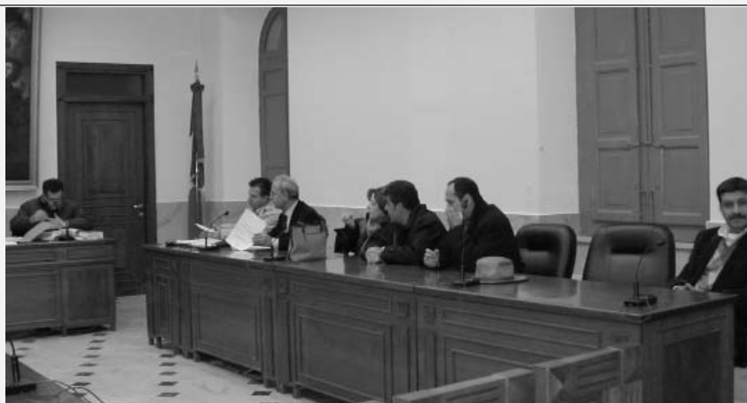
Due immagini della seduta consiliare che ha eletto il nuovo presidente del Consiglio

gruppi consiliari (in particolare il gruppo "Uniti per Collesano") si sono riservati di consultare i consiglieri dei rispettivi gruppi per discutere su alcune differenti modifiche da apportare al regolamento in esame emerse durante l'incontro. Inoltre si era in attesa del completamento di una istruttoria in corso tra l'Amministrazione e l'Istituto di Credito presente il loco per la definizione di una convenzione per la concessione di un prestito a condizioni agevolate agli assegnatari delle borse incentivanti. Va sottolineato che appena formulata la richiesta in Consiglio Comunale di prescindere da qualsiasi risposta in merito alla convenzione e alle posizioni dei gruppi consiliari (verbale n. 39 del 20.06.2002) si è proceduto all'inserimento dell'argomento all'ordine del giorno del Consiglio Comunale tenutosi in data 28.06.2002.