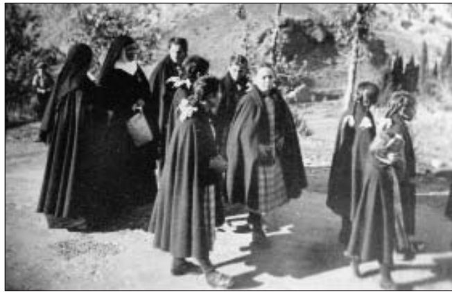
Gli ambienti della comunità e, a fianco, alcune suore e orfanelle a spasso per Isnello