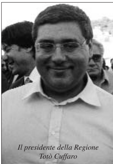
Il presidente della Regione Totò Cuffaro

"L'Altra Sicilia" fa osservare che il presidente della Regione siciliana, in base alle disposizioni statutarie, ha l'obbligo di essere presente nelle riunioni del Consiglio dei ministri, con la carica di ministro di Stato, quando sono da tutelare gli interessi della Sicilia e quando si discute di problemi e fatti che