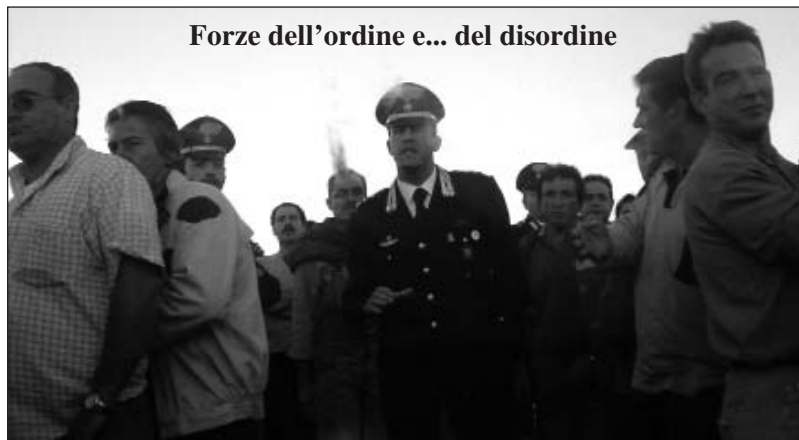
Forze dell'ordine e... del disordine

Continuano, forse inutilmente, i blocchi autostradali e portuali degli operai FIAT. I danni arrecati ai viaggiatori sono fastidiosissimi. La solidarietà dei siciliani comincia a venir meno.