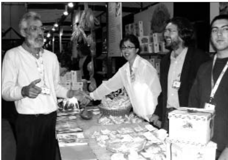
Gli stands della manna e del mannetto al Salone del Gusto di Torino