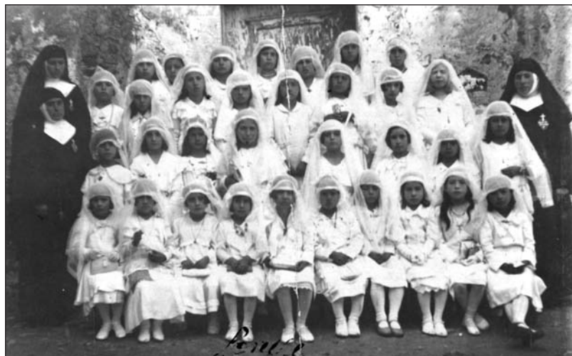
A fianco fanciulle in "pagliaccetto" alla colonia di Isnello negli anni '40 in piazza dei Caduti. In alto: prima comunione