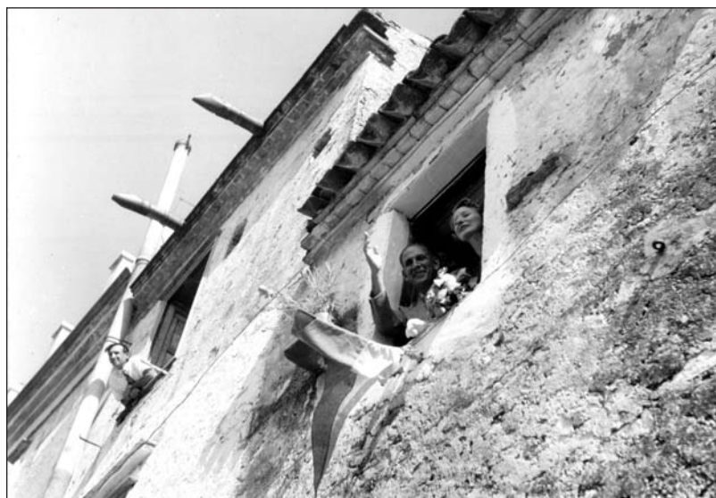
Qui sopra e nelle foto in basso: la venuta del sindaco di New York, Vincenzo Impellitteri, nel paese natìo (Isnello, 1951).