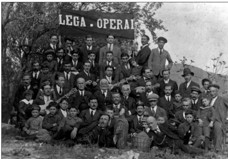
La Lega degli operai isnellesi nel 1922