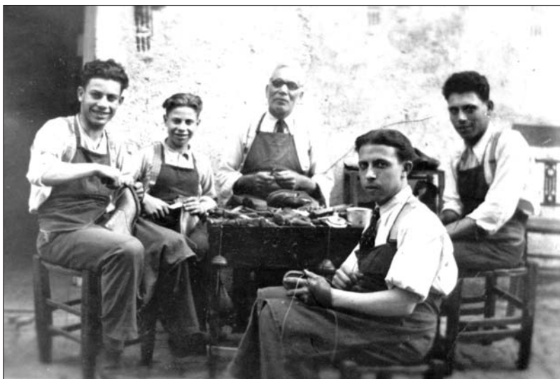
Calzolari d'altri tempi