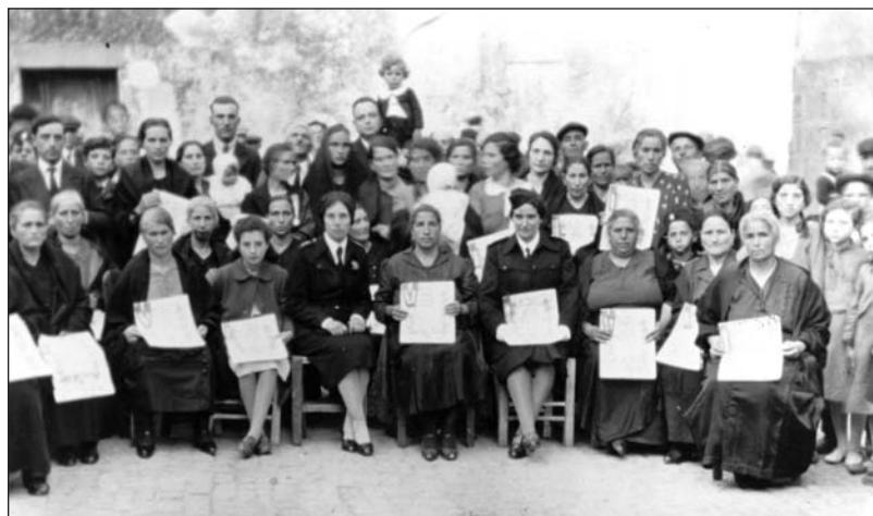
1934 - consegna del diploma alle famiglie più numerose