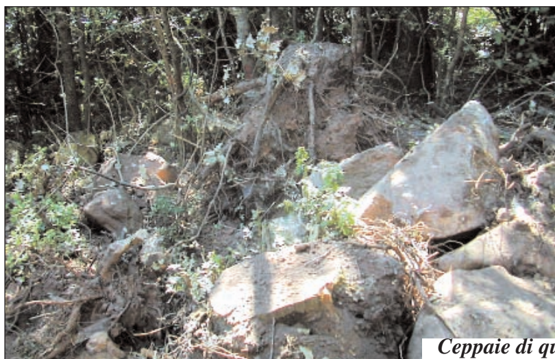
Ceppaie di querce eradiccate