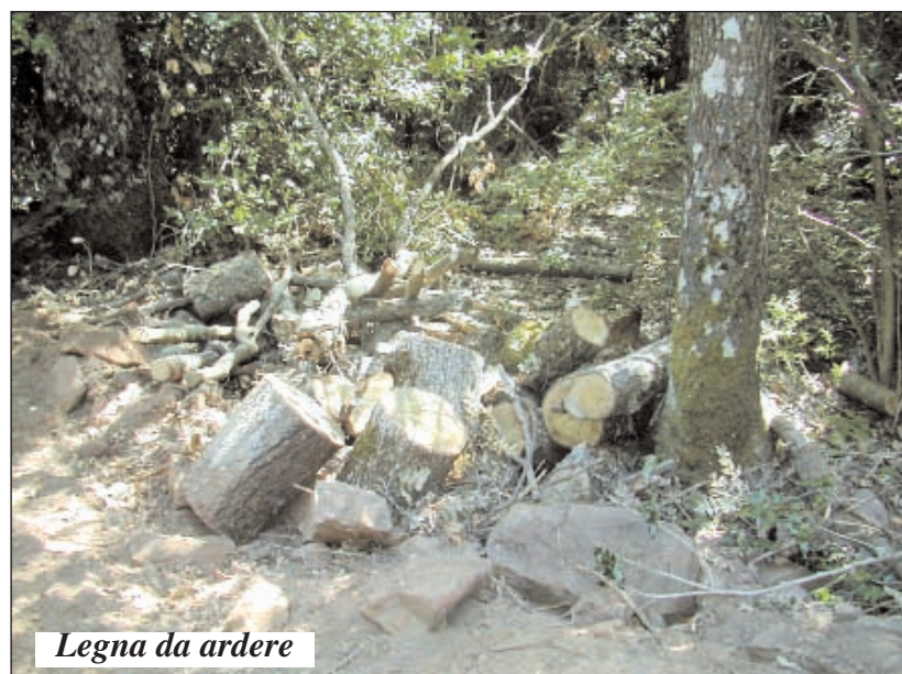
Legna da ardere