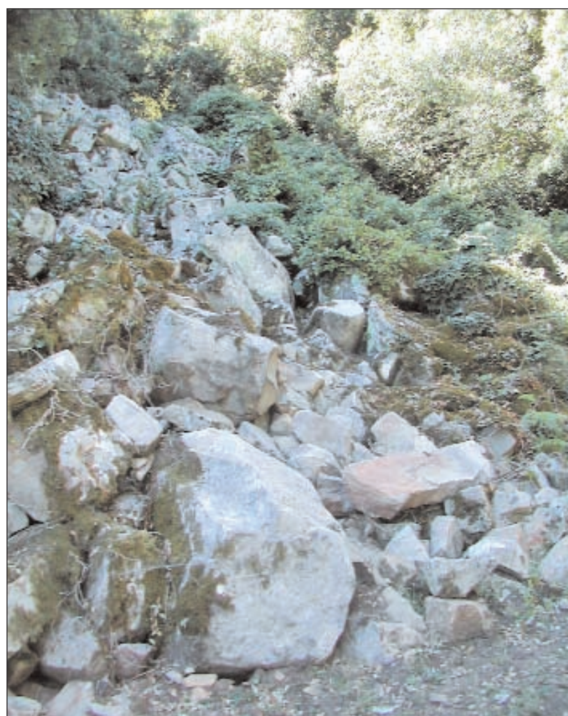
Dissesto geologico: una delle due pietraie scalzate dalle ruspe