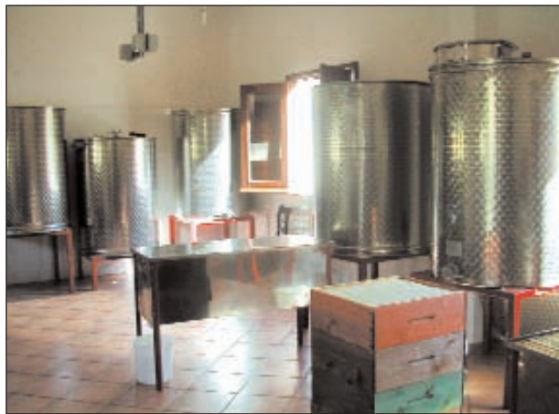
Il laboratorio per la lavorazione del miele e le arnie