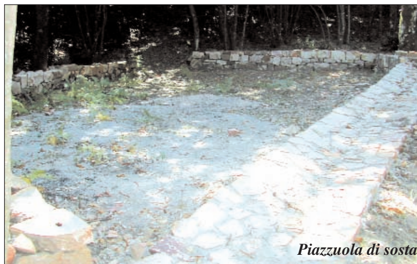
Piazzuola di sosta