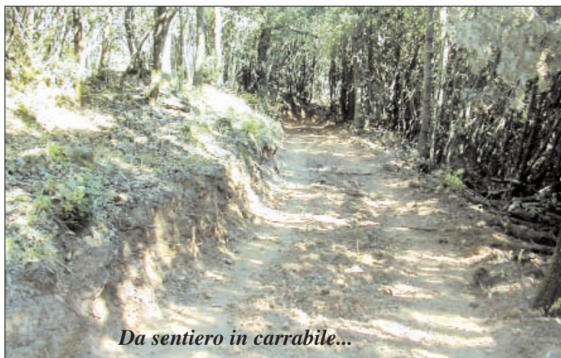
Da sentiero in carrabile...