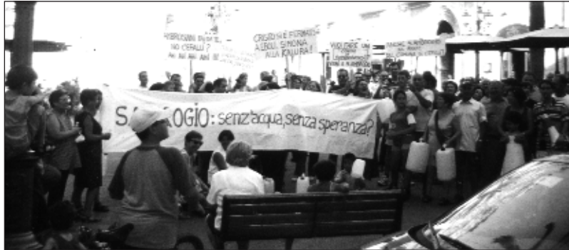
Gli abitanti della frazione di S. Ambrogio che il 3 luglio u.s. hanno inscenato una manifestazione di protesta in piazza Duomo, davanti al municipio di Cefalù

con le ovvie conseguenze di rottura della tubazione, ulteriore abbassamento piezometrico e conseguente interruzione del flusso principale in direzione dei serbatoi di accumulo a servizio del centro abitato della frazione".