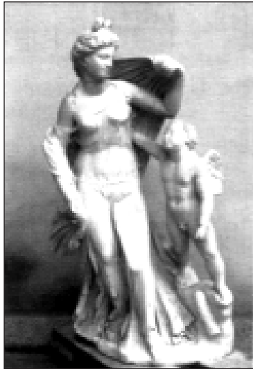
Afrodite ed Eros

Ultima e imponente fra le sculture il gruppo “Afrodite ed Eros”, quasi completamente danneggiata (mancava infatti la testa di Afrodite ed Eros era staccato dal resto). La scultura fa parte della collezione del