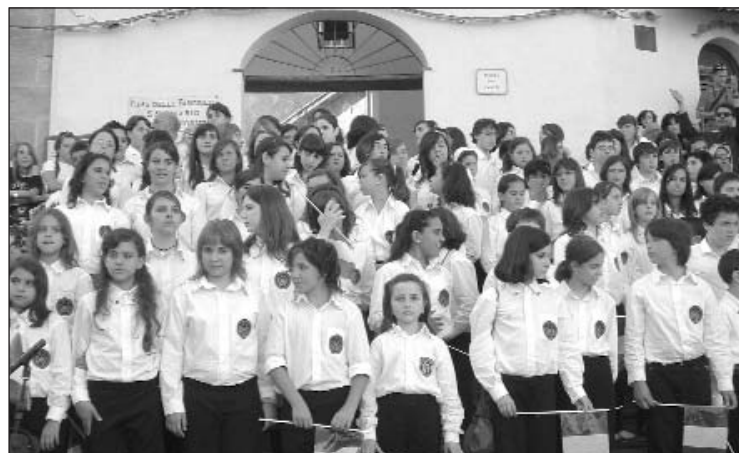
Il Coro di voci bianche