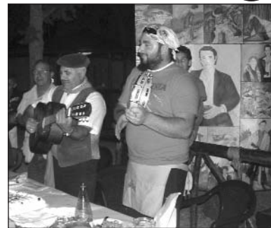
Cantastorie e appassionati