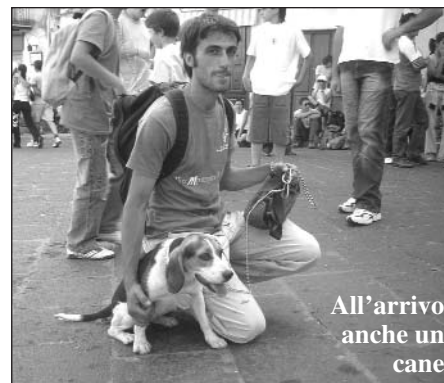
All'arrivo anche un cane