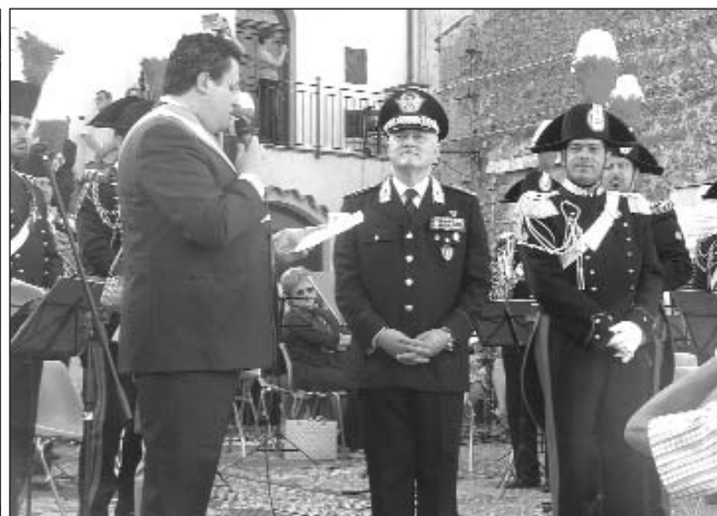
Il sindaco Alcamisi conferisce la cittadinanza onoraria al Gen. Piccirillo