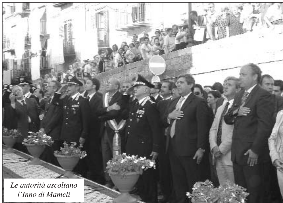
Le autorità ascoltano l'Inno di Mameli