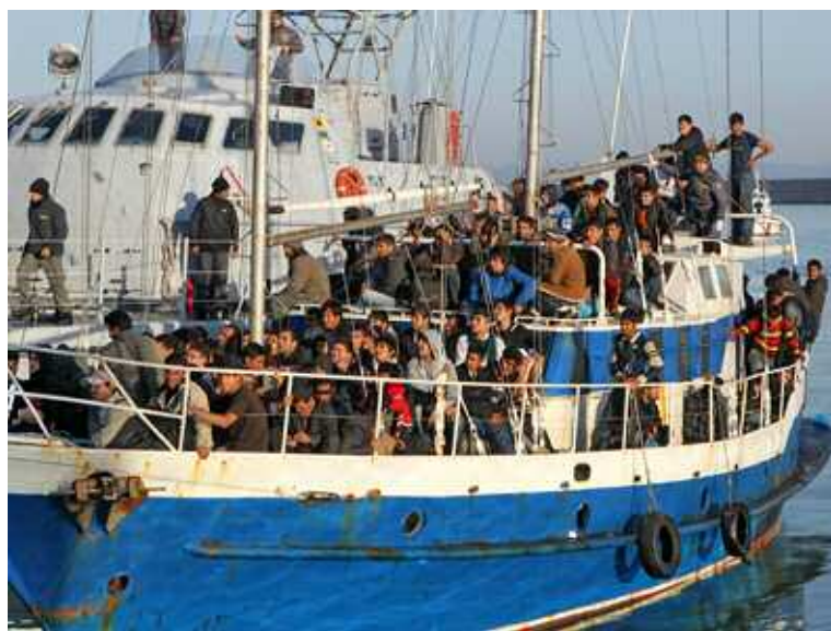
Nelle foto immagini di alcuni sbarchi in Sicilia