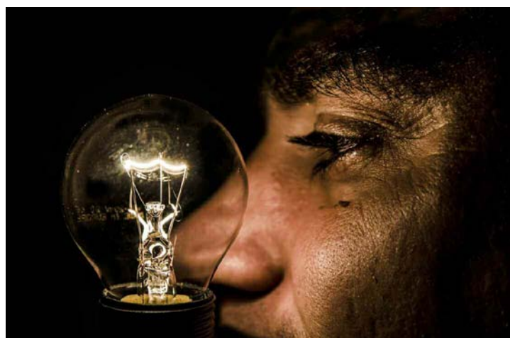
Lampadina di Francesco Prestianni