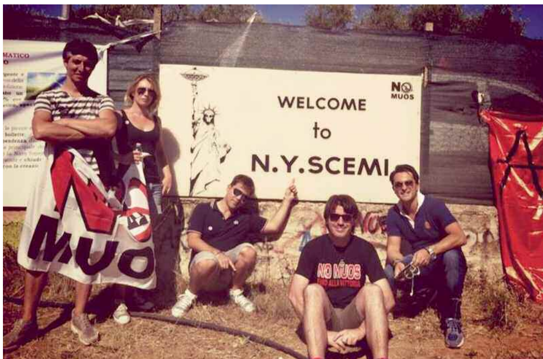
Europarlamentare Ignazio Corrao con manifestanti Muos il 9 agosto scorso