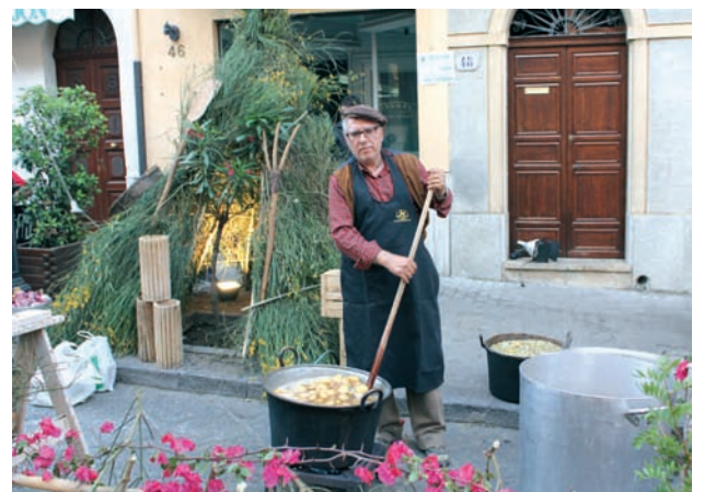
Parco delle Madonie, del GAL ISC Madonie.

L'iniziativa potrebbe rappresentare una fase del percorso di costruzione di un Eco-distretto rurale la cui realizzazione strategica, nella sua globalità, potrebbe essere realizzata, in futuro, col supporto dell'Assessorato regionale Agricoltura, dell'Ente