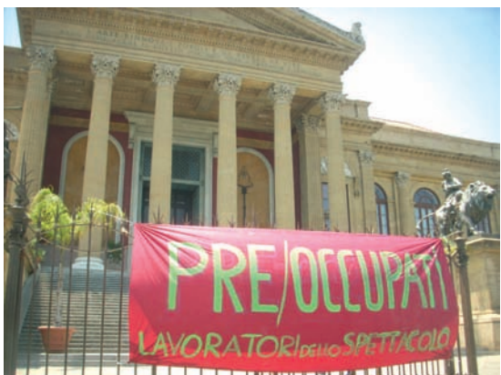
Il Teatro Massimo a Palermo