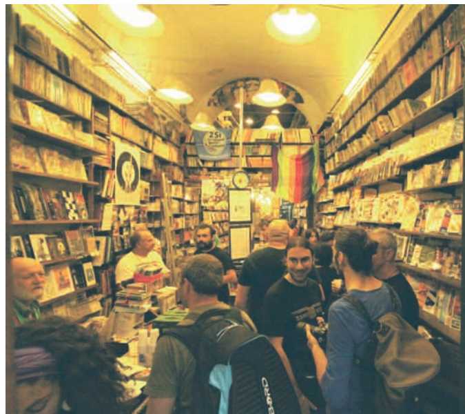
L'interno di "Altroquando"

Di queste contraddizioni, imbracciando matite e pennelli co-