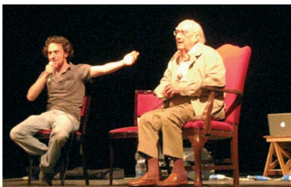
Elio Germano e Andrea Camilleri sul palcoscenico del teatro “Valle” occupato a Roma.